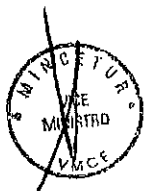
Aníbal Velásquez Valdivia Ministro de Salud